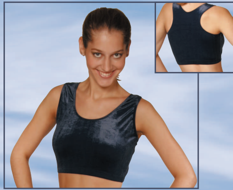
.111 TOP mit Rückensteg