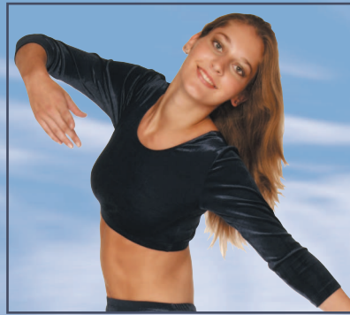
.113 TOP 3/4 Arm