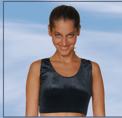
.11 TOP runder Hals